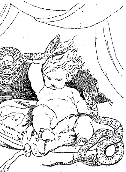
«Τά σφίγγει τόσο δυνατά...» (Σελ. 285, στ. 6'.)

έν όσω έμεγάλωνε. 'Ο θυμός του ήτο έν είδος μανίας, που όταν τον έπιανε, δέν ήξευρε τί έκκανε. Κάθε φοράν που έθύ-